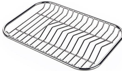
Rejilla portaplatos inox 8100 154