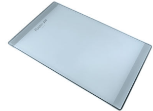
Tabla de corte de cristal 8631 300